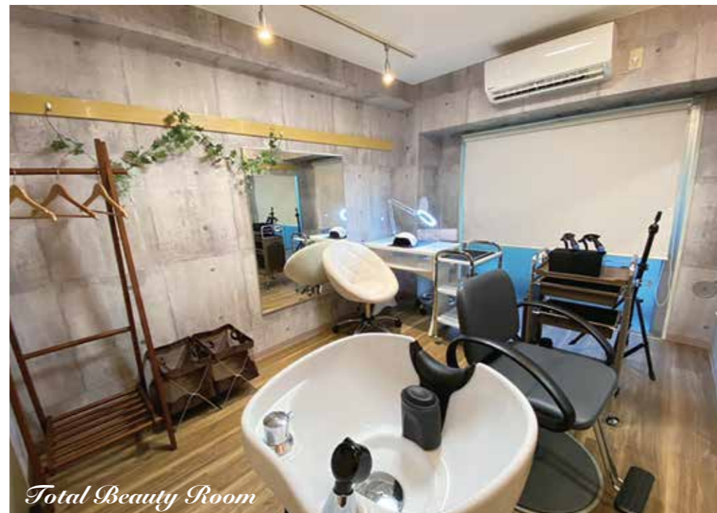
Total Beauty Room